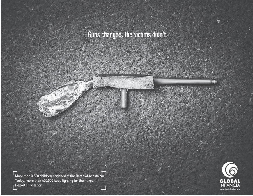
Resim 2. "Silah" Konulu Kamu Spotu Reklamı