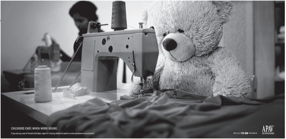
Resim 4. “Oyuncak” Konulu Kamu Spotu Reklamı

makinesinde çalışan kadın görselini arka planda ve bulanık bir şekilde yansıtılmaktadır. Oyuncak ayının bulunduğu dikiş makinesi masası ise posterin merkezinde konumlandırılmaktadır. Posterdeki sunum kodları içerisinde oyuncak ayı üzgün ve yorgun bir şekilde aktarılmaktadır. Posterin sol altında “Çocukluk, iş başladığında biter. Herhangi bir zorunlu çocuk işçiliği vakası görürseniz, bildiriniz. Çocukları çalışmaya zorlamak bir suçtur ve cezai yaptırım uygulanır” yazılı kodu bulunmaktadır (Resim 4).